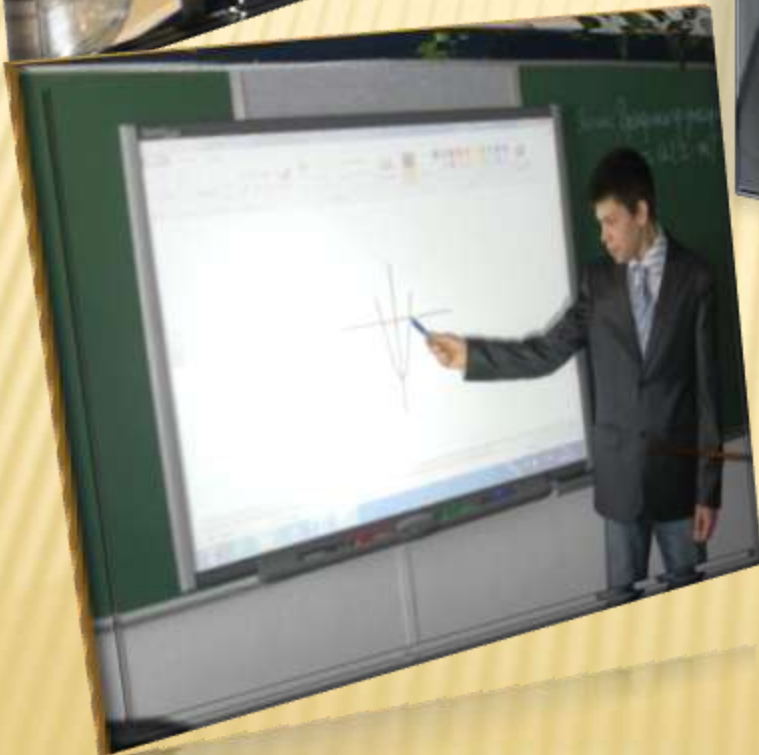
Работа с интерактивной доской